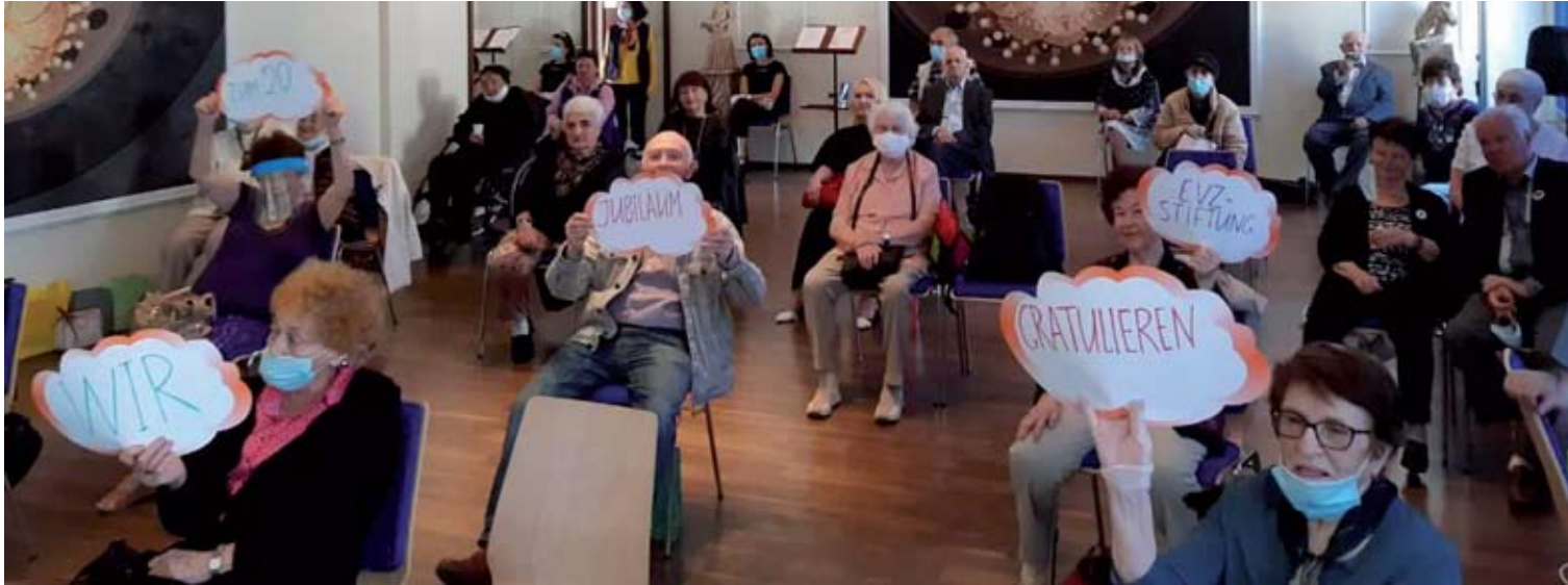
Treffen der Gruppe, Informationsveranstaltung, 2020