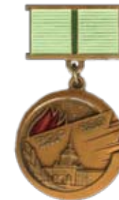
Abzeichen "Für Einwohner Leningrads während der Blockade: 900 Tage - 900 Nächte"

Знак "Жителю блокадного Ленинграда: 900 дней - 900 ночей"