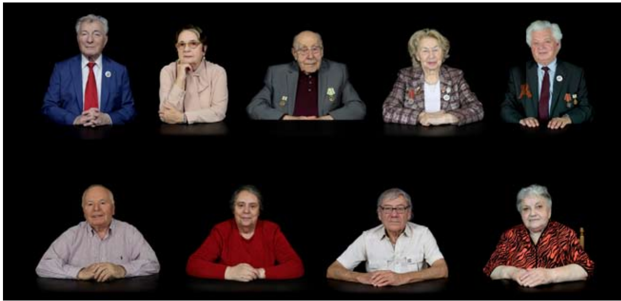
Überlebende der Leningrader Blockade als Teilnehmer des Berliner Videoprojektes "Kinder der Blockade", 2019. Projekt und Foto von Ina Rommee und Stefan Krauss.