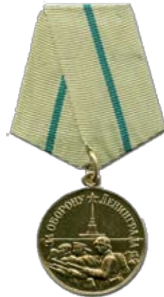
Medaille "Für die Verteidigung Leningrads"