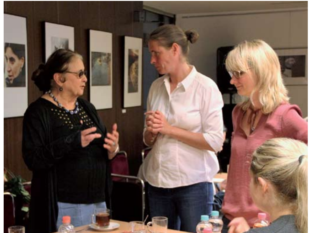
Erzählung über das Überlebte. Рассказ о пережитом.