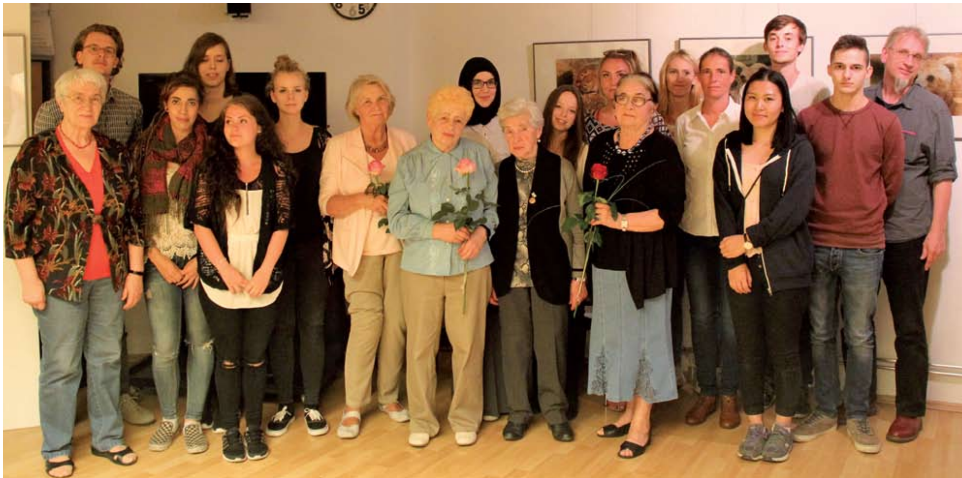
Treffen der „Blokadniki“ mit jungen Leuten, den Teilnehmern eines FSJ-Seminars beim Club Dialog e.V. im Juli 2016.

едут, обгоняя нас, красноармейцы, боевая техника. Наша воспитательница машет, кричит, просит о помощи. К концу дня, вдруг рядом с нашей группой остановился грузовик. Командиру, видимо, стало жаль детей. Он знал наверняка, что через несколько минут здесь будут немцы. Всех нас забросили в кузов и поздно вечером мы оказались в объятиях нашей дорогой и любимой мамы, и тётки Веры.