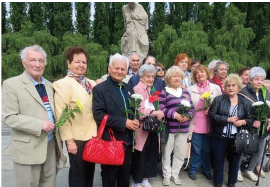
Ausflug im Treptower Park, 2018