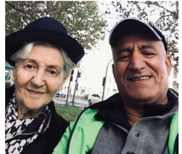
Überlebende der Blockade mit Geflüchteten – Teilnehmern eines BFD-Seminars, 2019