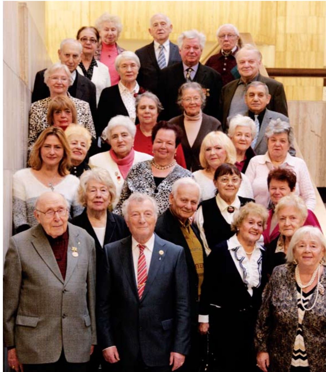
Mitglieder der Berliner Vereinigung "Lebendige Erinnerung"