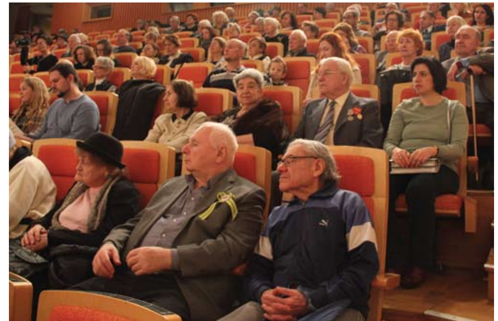
Gedenkveranstaltung anlässlich der vollständigen Aufhebung der Blockade im Russischen Haus Berlin, 2019