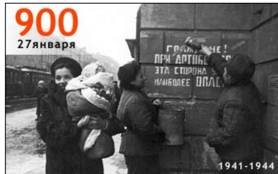
Leningrad, SNewskij Prospekt

“Diese Straßenseite ist bei einem Artilleriebeschuss besonders gefährlich!” – solche Aufschriften fand man überall in Leningrad während des Krieges und lange Zeit danach.