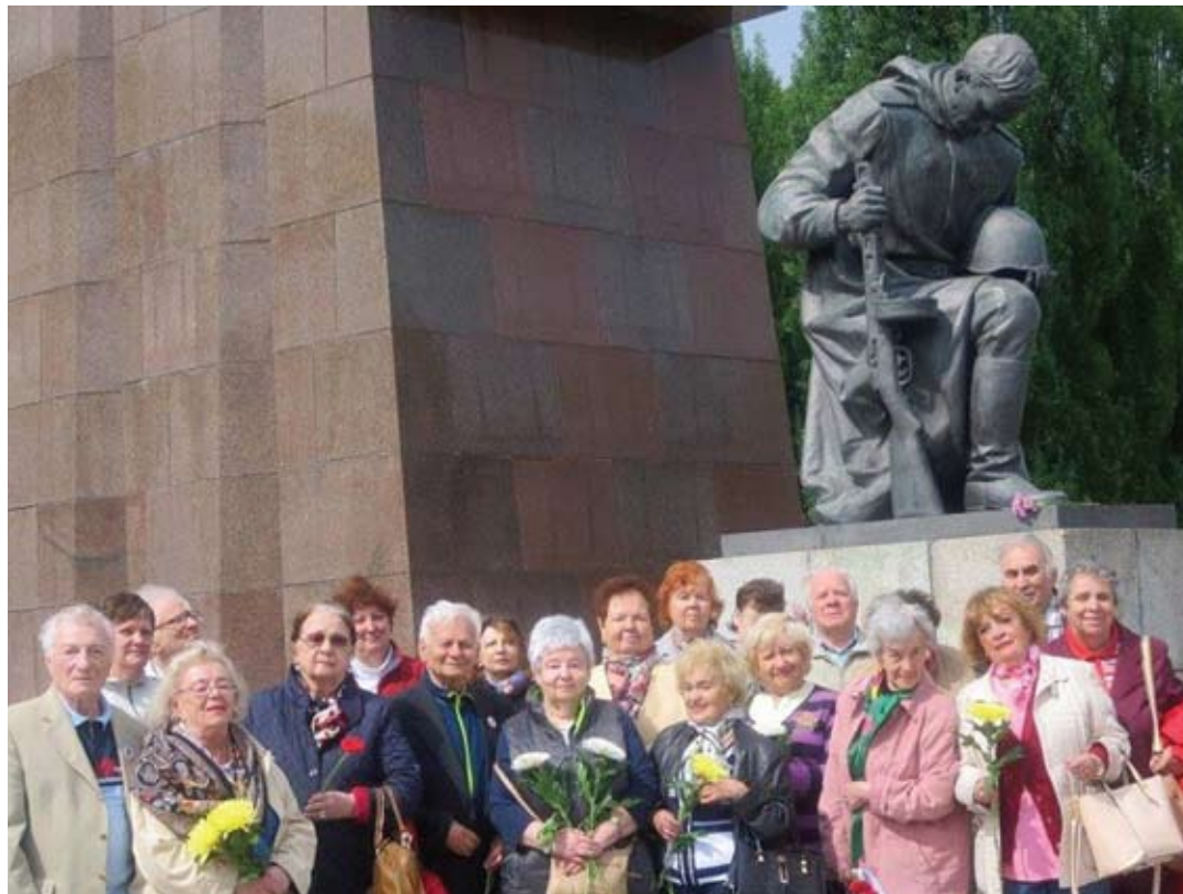
Ausflug im Treptower Park, 2018