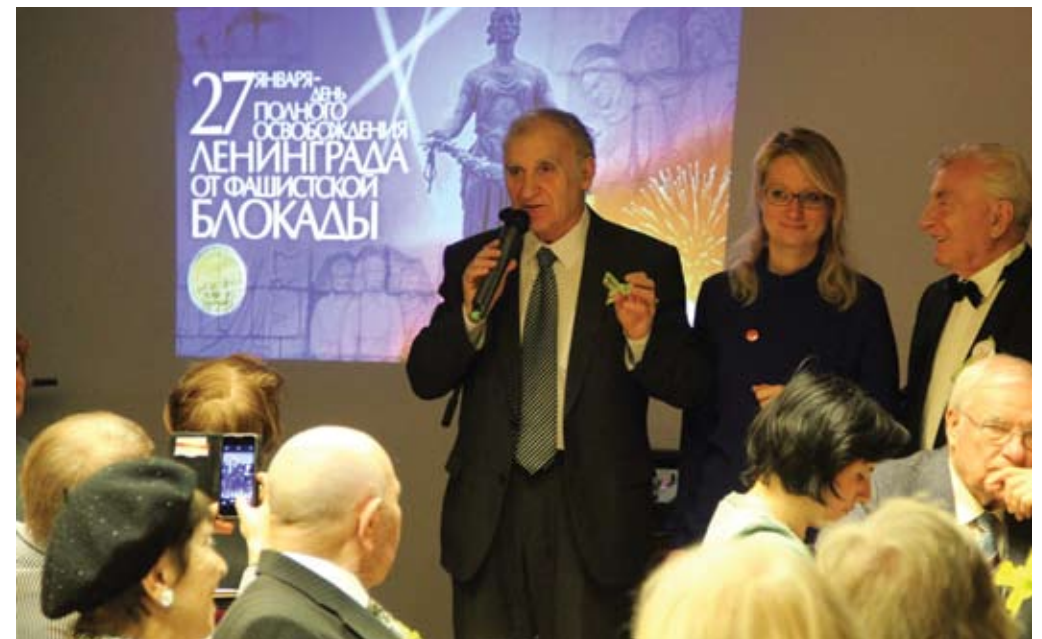
Treffen mit Gästen aus St. Petersburg anlässlich des Jahrestages der vollständigen Aufhebung der Blockade, 2019