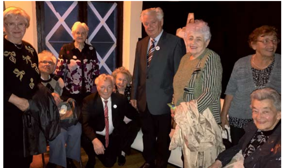
Im Berliner "Theater unterm Dach" bei der Aufführung des deutsch-russischen Stückes "67/871" (871 Tage in 67 Bildern) in Zusammenarbeit mit dem "Theater auf Litejniy", (St.-Petersburg), 2017