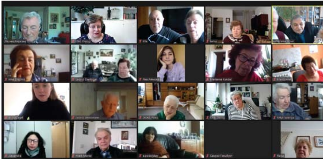
Treffen der Vereinigung „Lebendige Erinnerung“ im Zoom, 2021